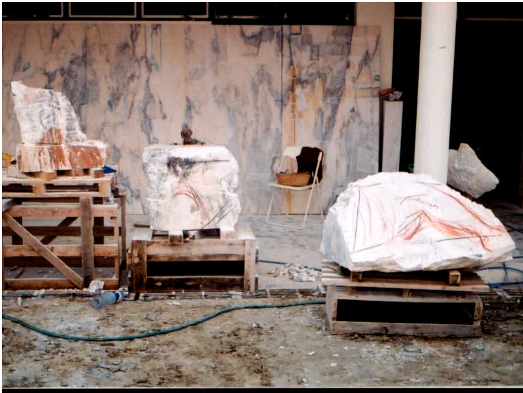
De marmer-werkplaats van Molona in Portugal