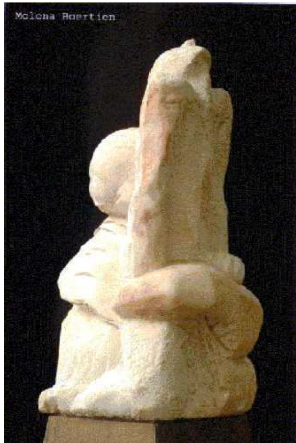
"Mens en Hartstochten" (beeld in rose marmer)

Hieronder vindt U enige informatie over de werkwijze en de omstandigheden, waaronder het beeld is ontstaan. Het beeld in de uiteindelijke vorm is een zelfstandige entiteit. Molona vraagt U dan ook, om het beeld onbevangen tegemoet te treden, en de visuele beleving ervan te ondergaan.